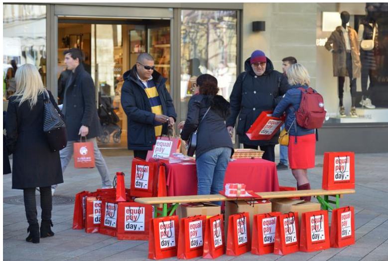
Equal Pay Day 2020: stand d'information des BPW Genève dans les rues piétonnes.